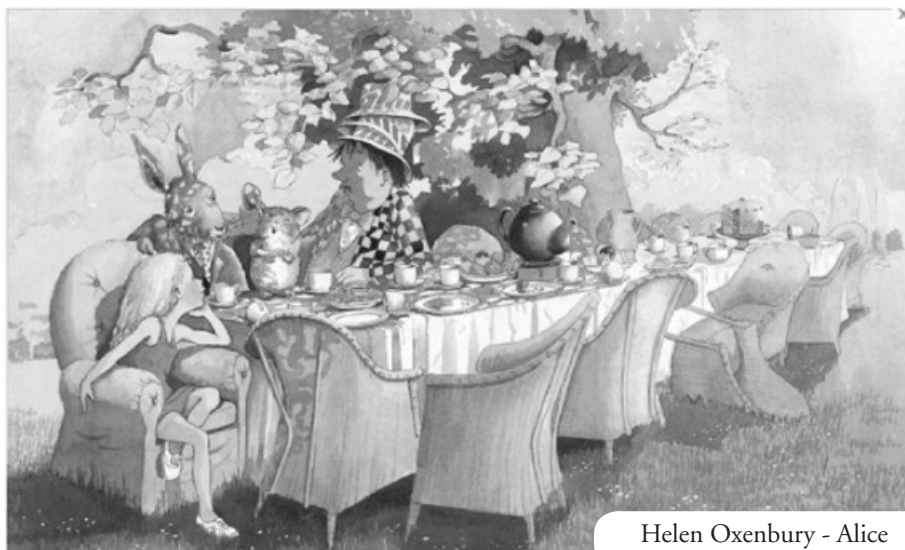
Helen Oxenbury - Alice

A conclusão neste campo, então, assinala a força da independência literária bem entendida, da atenção com a ótica do leitor e a dignidade dos livros instrutivos.